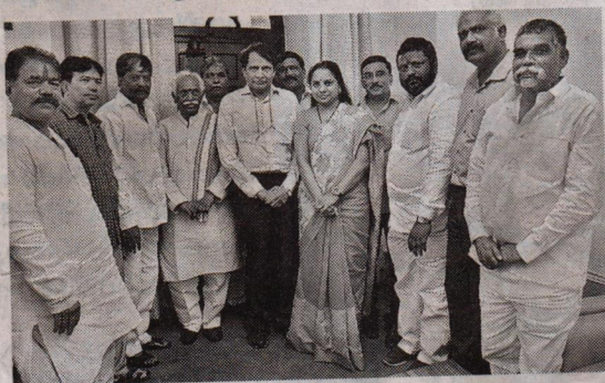
నవతెలంగాణ - న్యూఢిల్లీ బ్యూరో